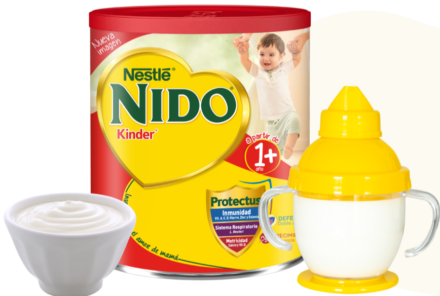
Inmunonutrientes y probióticos